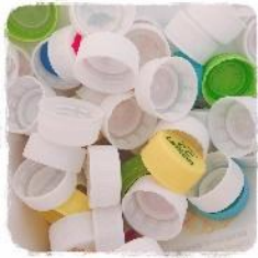
ペットボトル キャップ